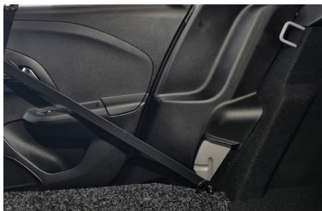
UCHWYTY. Wiele punktów mocowania ładunku.