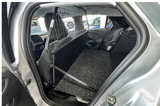
DRZWI BOCZNE TYLNE. Wygodny dostęp do ładunku nie tylko od tyłu.