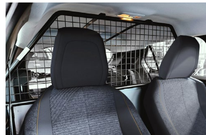
PRZEGRODA. Wytrzymała krata zabezpieczająca przedział osobowy jednocześnie dająca możliwość pełnego odsunięcia foteli.